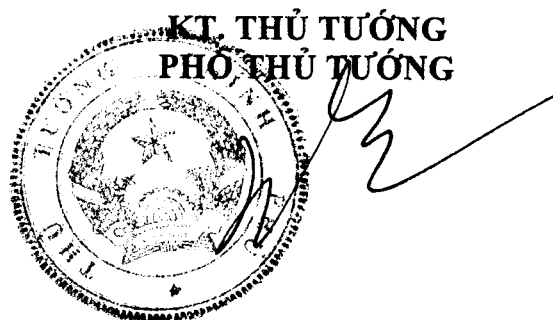
Trương Vĩnh Trọng

Nhà nước đầu tư cơ sở vật chất - kỹ thuật cho hoạt động thống kê về phòng, chống ma túy; ưu tiên đầu tư cho việc ứng dụng công nghệ thông tin vào hoạt động thu thập, báo cáo, công bố, quản lý thông tin, xây dựng hệ thống dữ liệu và mạng thông tin thống kê về phòng, chống ma túy./.