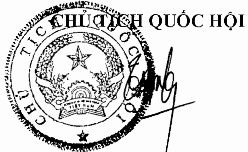
Nguyễn Phú Trọng

Luật này đã được Quốc hội nước Cộng hòa xã hội chủ nghĩa Việt Nam khoá XII, kỳ họp thứ 9 thông qua ngày 29 tháng 3 năm 2011.